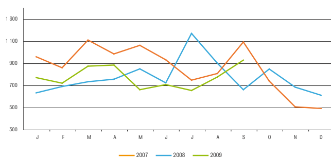
Évolution des postes hors intérim et aides publiques et hors PFI

À un an d'écart, le nombre de postes est orienté à la baisse : - 18,5 % (contre - 16,1 % en région wallonne), ce qui correspond à une perte de 1 589 postes. On observe un certain redressement de la courbe à partir du mois d'août 2009.